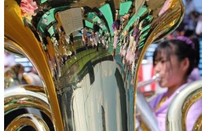
写真 岐山高校 『青春セレモニー』