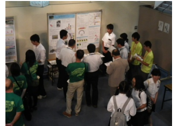
自然科学 岐山高校 『カワニナを通して考える地域の生態系 〜ひとつふたつなどほのかにうちひかり て行くもおかし〜』 (審査風景)

本県から出場した部門は、17部門です。本年度は、設立したばかりの小倉百人一首かるた部会が合同チームで全国の舞台に臨みました。マーチングバンド・バトントワリング部門に出場した関商工高校は、総合開会式のパレード部門にも出場しました。