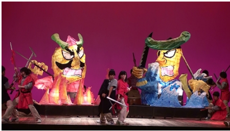
演劇 岐阜農林高校 『掌〜あした卒業式〜』 (国立劇場優秀校公演)