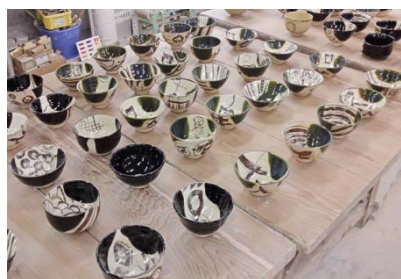
多治見工業高校が制作した茶碗

本年度は隣県開催ということで、総合開会式前日に行われる茶会の席に本県が招待をいただきました。そこで、その茶会で使用される茶碗の一部を多治見工業高校の生徒たちが制作しました。立派に仕上がった茶器と制作の工程をまとめたパネルを、富山県に運びました。茶会は国宝瑞龍寺で開かれました。